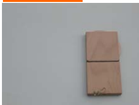
Klappe mit Band